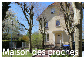
Maison des proches

Les proches peuvent être hébergés pour une nuit ou quelques jours à la "Maison des Proches", en studio équipé. Les tarifs et renseignements sont disponibles auprès au 01 69 23 20 69