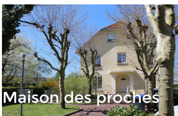
Maison des proches