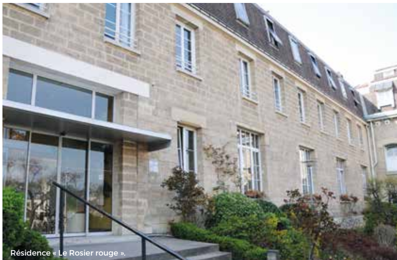
Résidence « Le Rosier rouge ».