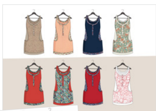
Les nouveaux modèles du groupe Mulliez-Flory, 2012