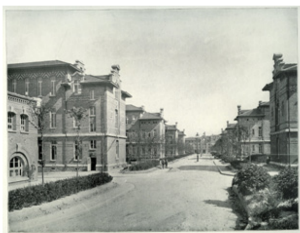
L'architecture pavillonnaire du nouvel hôpital de La Pitié, 1913