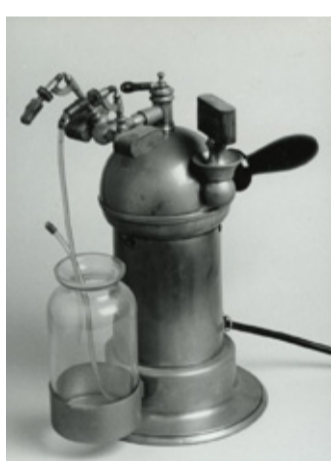
L'appareil de Lucas-Championnière Musée de l'AP-HP