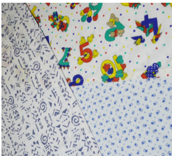
Diversité des motifs sur les tenues des patients

Enfin, depuis 1972, chaque professionnel porte un badge sur lequel est indiqué son nom. Une deuxième information essentielle y est glissée : celle de la fonction. C'est le rôle de la couleur de fond : rouge pour les médecins, orange pour les étudiants en médecine, bleu pour les paramédicaux, vert pour les personnels techniques et gris pour les personnels administratifs.