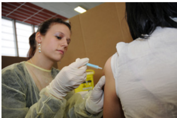
Une soignante dans sa blouse non-tissée, 2010