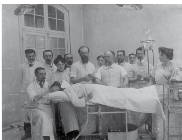
Une équipe en salle d'opérations, v. 1910