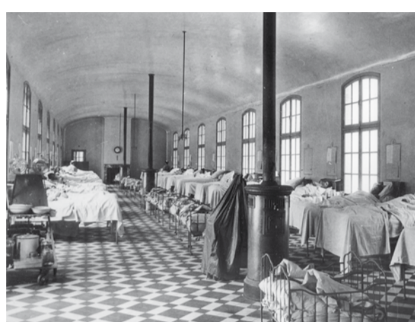
Carrelage et mobilier métallique dans la salle des accouchées, Hôpital Tenon, v. 1910