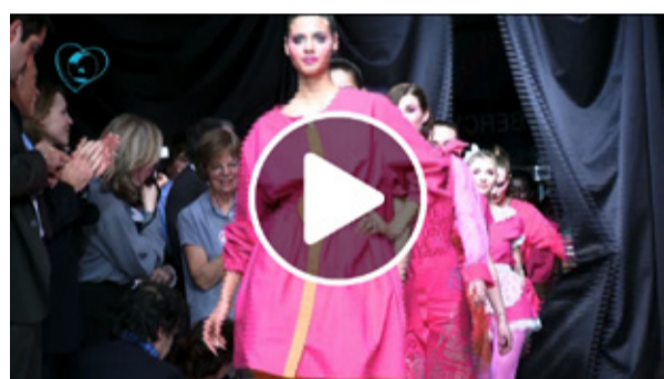
Le défilé des Blouses roses, mars 2009